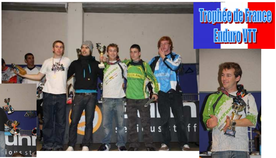
Le Top 5 du Trophée.